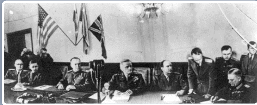
Signature des conditions de la capitulation allemande, Berlin, Allemagne, le 8 mai 1945