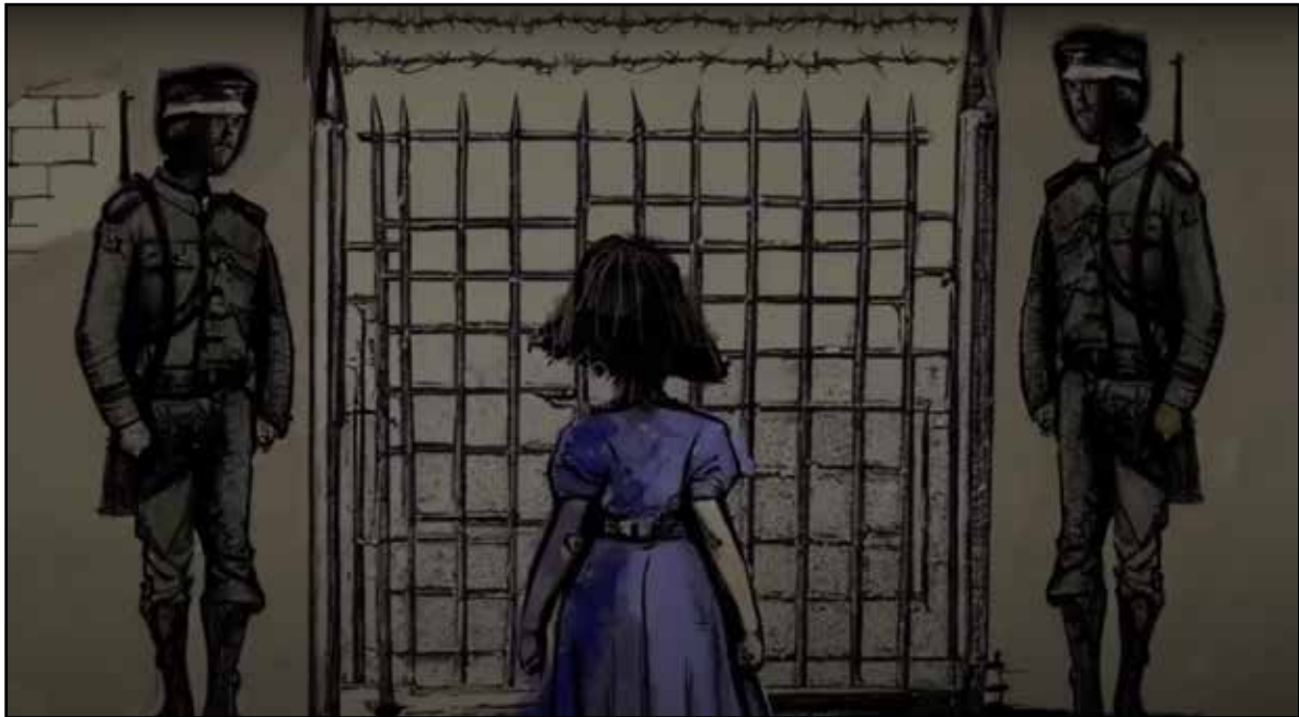
הציור נוסף ליצירות של פאני ע"י הפקת הסרטון

כך סיפרה פאני: "אחר כך בא לי רעיון ואמרתי: 'תגידו, אתם צרפתים?' הצרפתים האמיתיים לוחמים נגד האויב.... ככה שחררו את אמא שלי. הייתי בת 12".