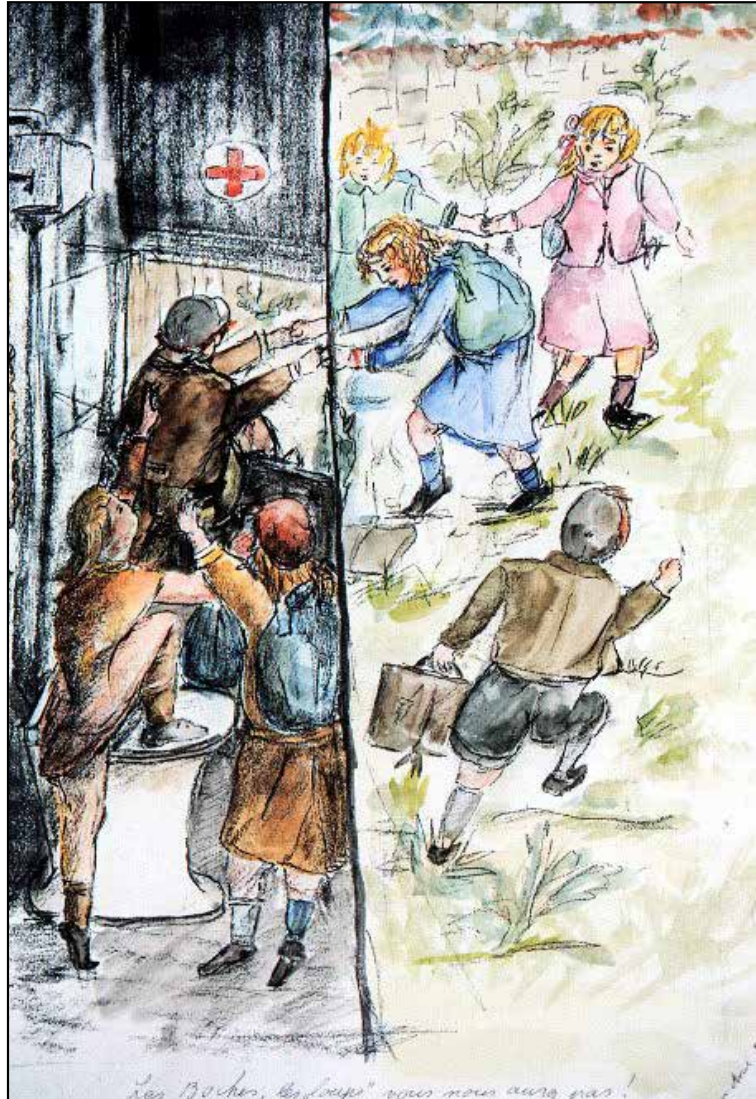
ציור: פאני בן עמי