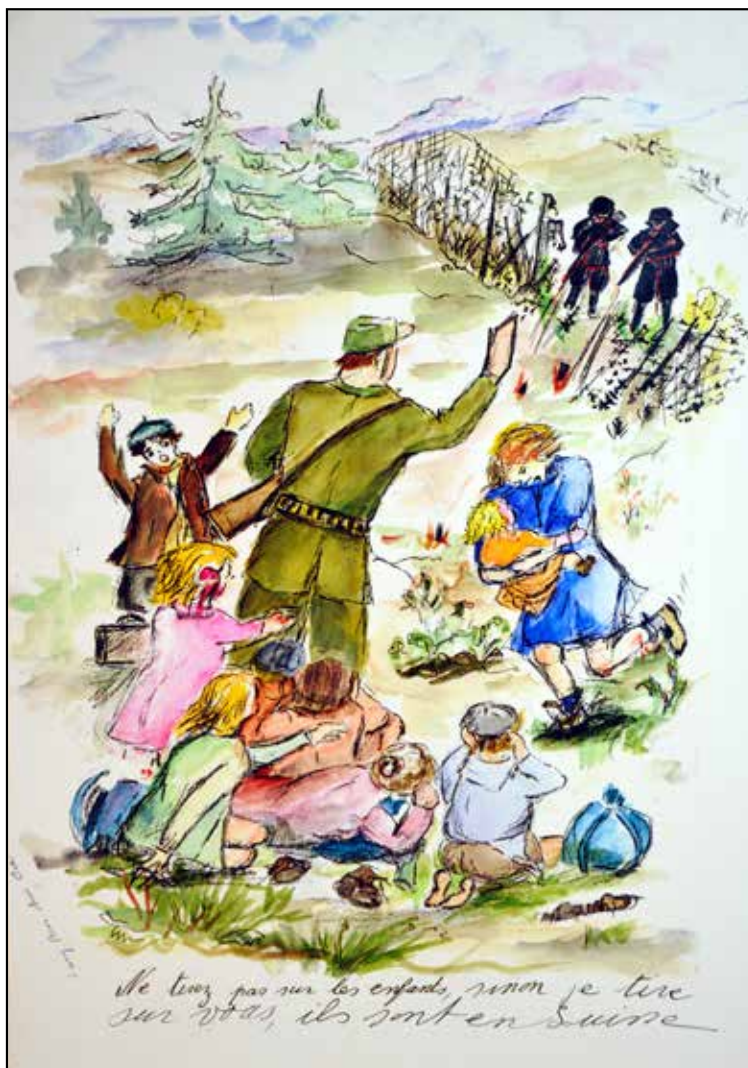
ציור: פאני בן עמי