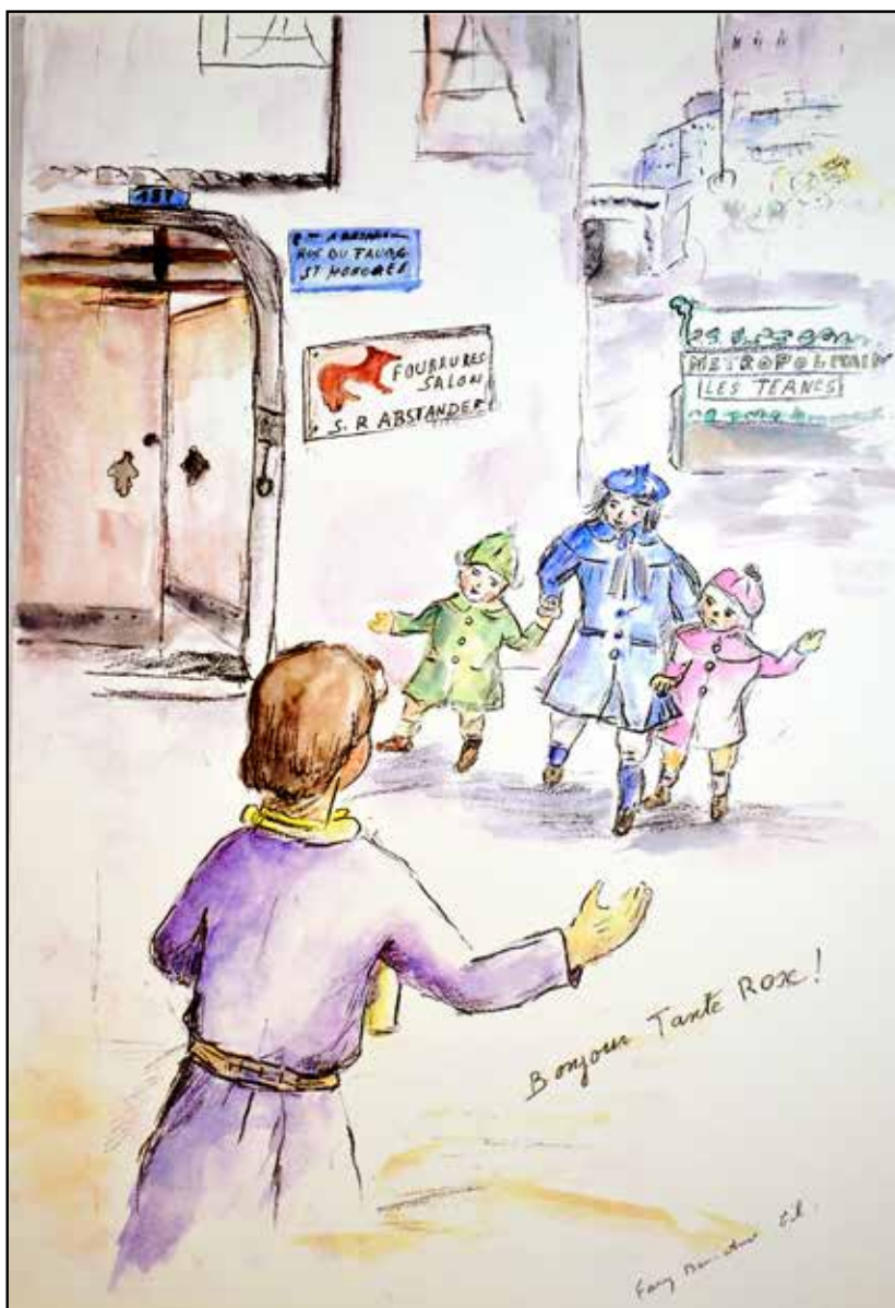
ציור: פאני בן עמי

כיצד בחרה פאני לתאר בציור, את הקשר שלה עם אחיותיה ועם אמא שלה?