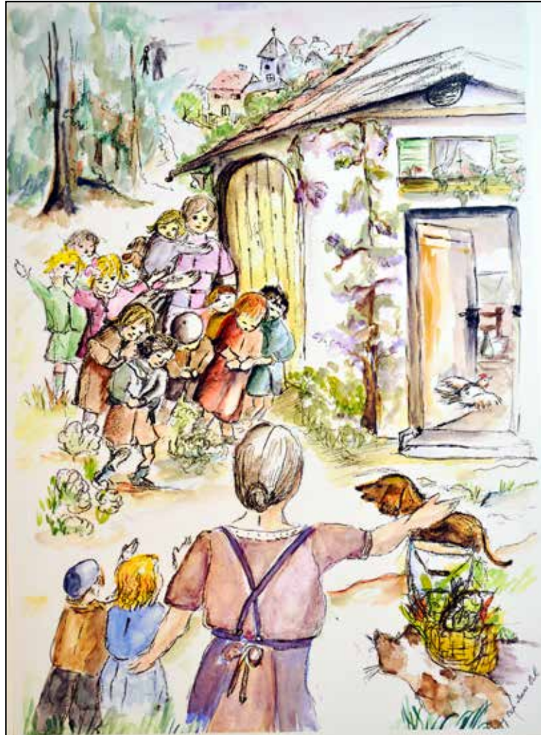
ציור: פאני בן עמי